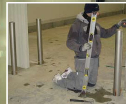
Stootranden met uitsparing voor de vloer en RVS aanrijpalen